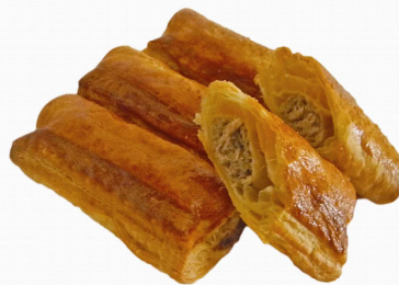
COD.HO210 PASTEL DE CARNE 120gr 50unds