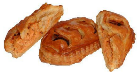
COD.HO225 PASTEL POLLO PIRI PIRI 110gr 40unds