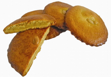
COD.C240 GALLETA DE ALMENDRA 120grs 54unds