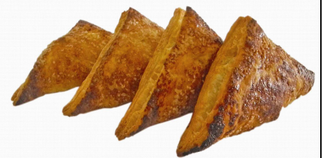
COD.HO220 TRIÁNGULO DE MANZANA 130grs 40unds