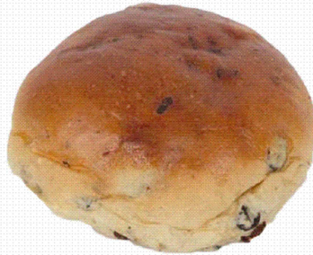
COD.96 MINI BOLLO PASAS 450g 10bolsas COD.95 BOLLO PASAS 70gr 28und