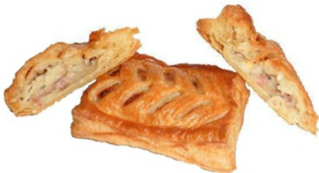
COD.HO215 MALLA DE JAMÓN Y ESPÁRRAGOS 110gr 40unds