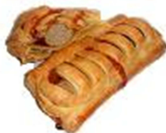
COD.HO280 MALLA FRANKFURT CON SALSA CURRY 175gr 30unds