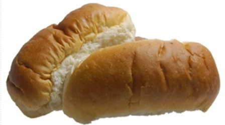
COD.85 PANECILLO BLANCO 40gr 20 und.