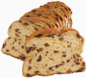
COD.70 Pan de pasas 500gr 16unds