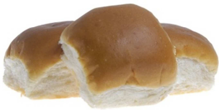
COD.80 BOLLO BLANCO 60gr 20unds