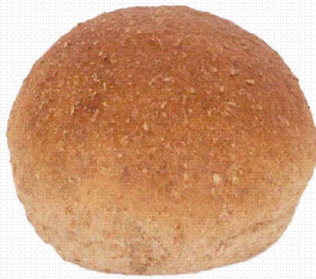
COD.90 BOLLO INTEGRAL 60gr 20unds