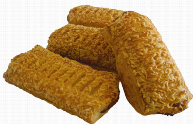
COD.HO230 MALLA DE QUESO HOLANDÉS 130gr 60unds

PRECALENTAR 220°C HORNEAR 170- 180 °C 25-30 min